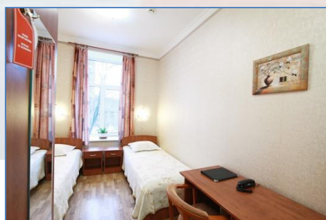
Номер категории Бизнес

Филиал отеля – Дом Бенуа (категория **+) находится в здании языковой школы «Златоуст» и предлагает 6 номеров. Все номера однокомнатные и оборудованы удобной мебелью и рабочим местом. На нашей уютной кухне вам будет предложен завтрак – расширенный континентальный.